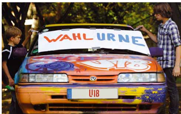
Philipp Gülland / ddp

Die U18-Wahl funktioniert fast genauso wie die der Erwachsenen – mit Stimmzetteln, Wahlkabinen und Wahlurnen. Die Wahlurne bastelt jedes Wahllokal selbst, und die schönste Urne wird am Ende prämiert.